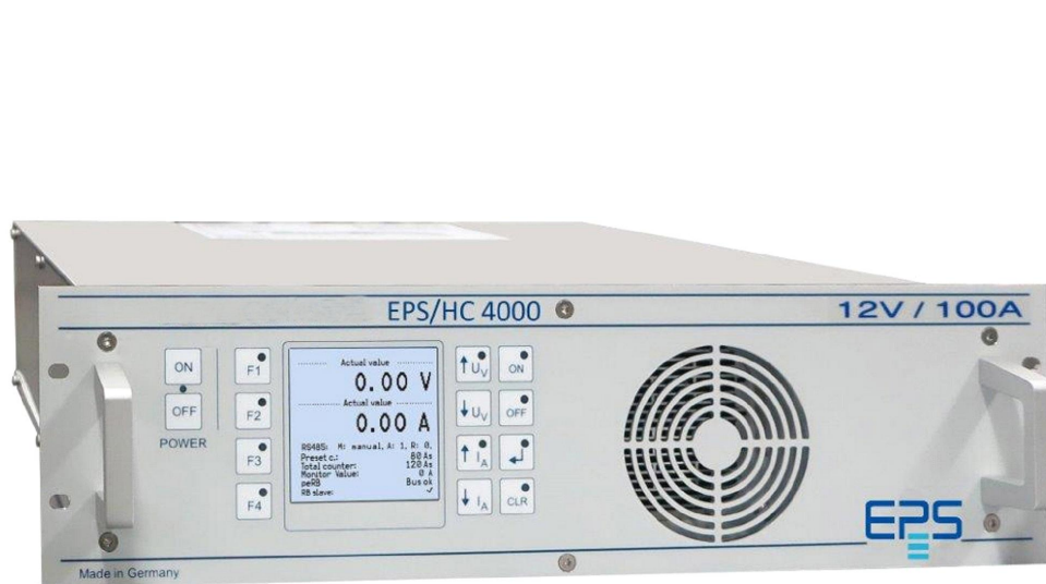
EPS/HC 4000 19"