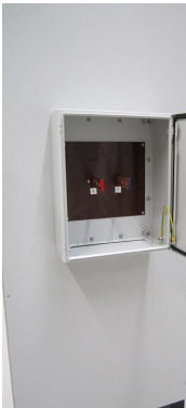
EPS/HC 5000-WC(low current)_rear