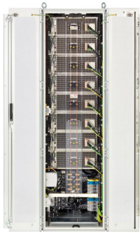
EPS/PUx 10000 Rack rear

Irrtümer und Änderungen vorbehalten/Alle Wertangaben sind typische Werte