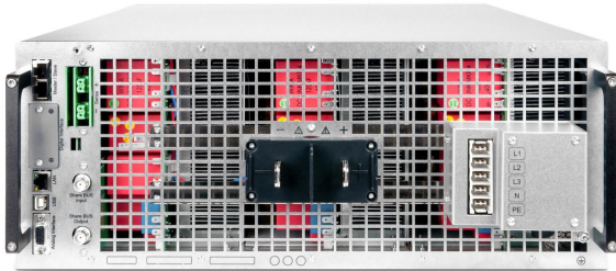
EPS/PUx 10000_4U rear