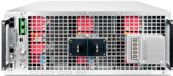
EPS/PUx 10000_4U rear