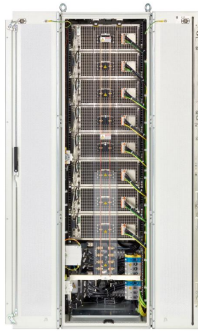
EPS/PUx 10000 Rack rear

Irrtümer und Änderungen vorbehalten/Alle Wertangaben sind typische Werte