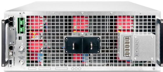
EPS/PUx 10000_4U rear