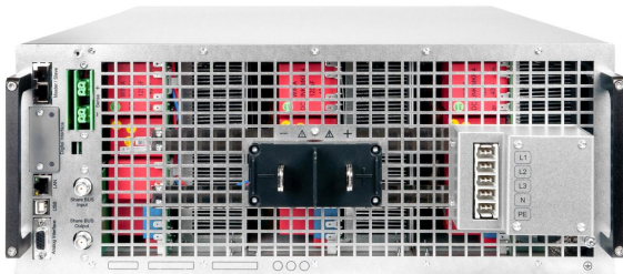
EPS/PUx 10000_4U rear