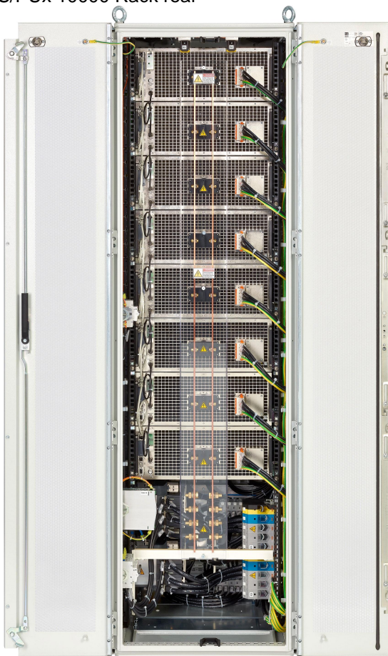
EPS/PUx 10000 Rack rear

Irrtümer und Änderungen vorbehalten/Alle Wertangaben sind typische Werte