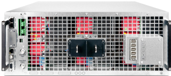
EPS/PUx 10000_4U rear