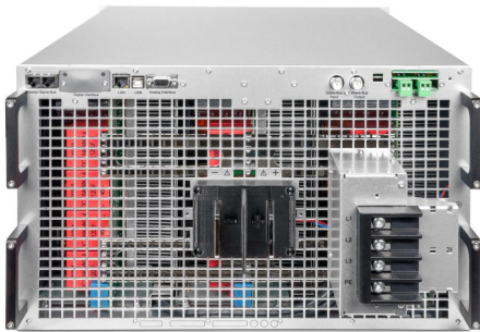
EPS/PUx 10000_6U rear