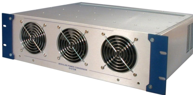
EPS/FC 3000-4500 19rack