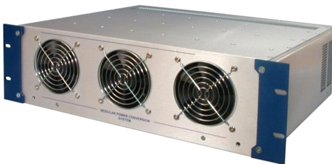
EPS/FC 3000-4500 19rack