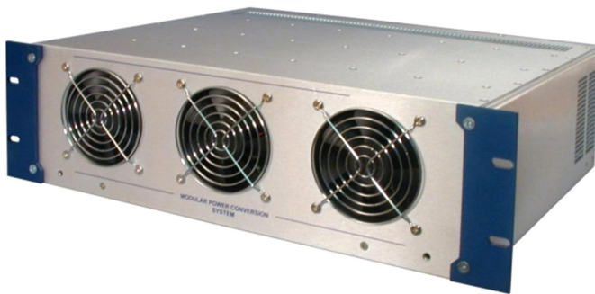
EPS/FC 3000-4500 19rack