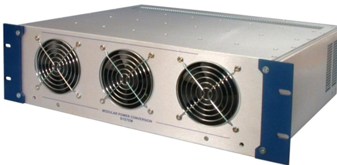
EPS/FC 3000-4500 19rack