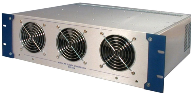
EPS/FC 3000-4500 19rack