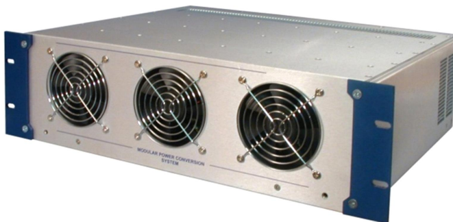
EPS/FC 3000-4500 19rack