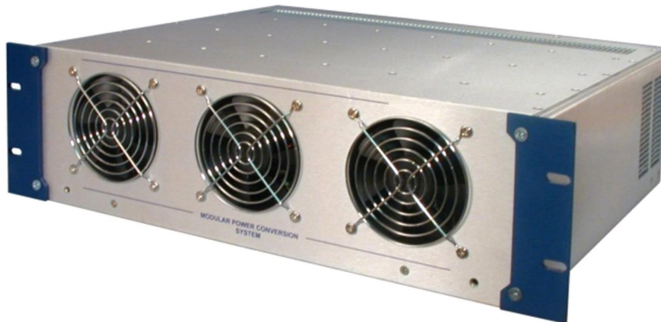
EPS/FC 3000-4500 19rack