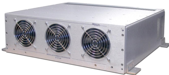
EPS_FC 3000 Chassis