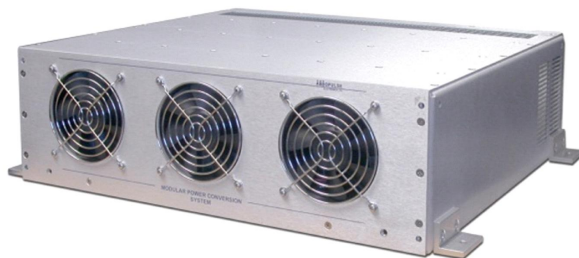
EPS/FC 3000-4500 Chassis