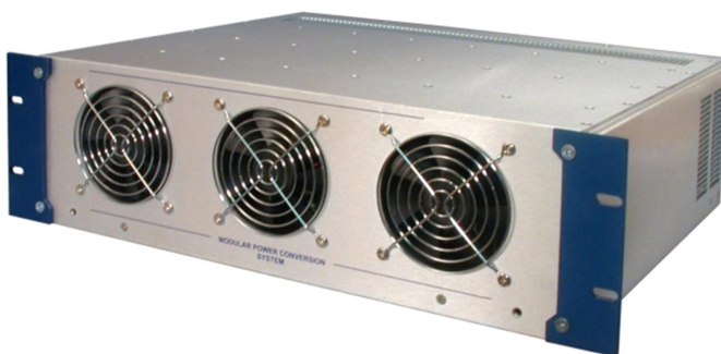
EPS/FC 3000-4500 19rack