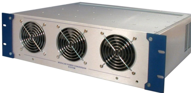
EPS/FC 3000-4500 19rack