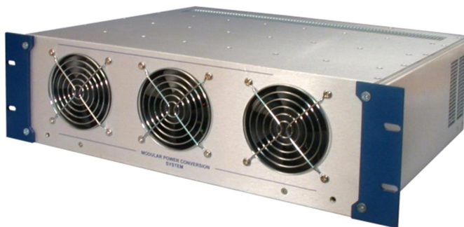
EPS/FC 1000-3000 19"