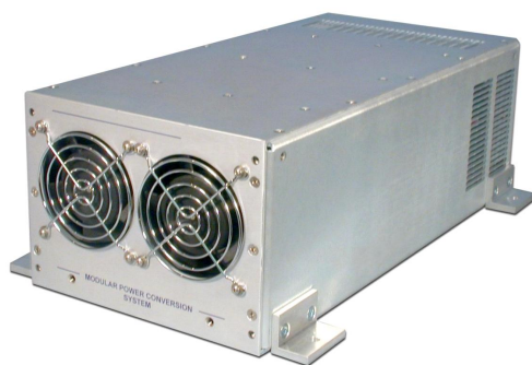
EPS/FC 1000_1500 Chassis