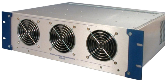
EPS/FC 4000 19rack