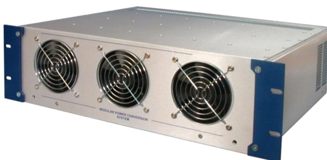
EPS/FC 3000-4500 19rack