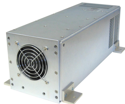
EPS/FC 500 Chassis