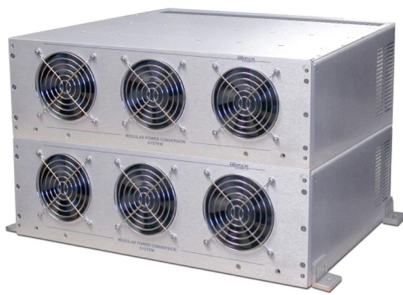
EPS/CPT 6KVA Chassis